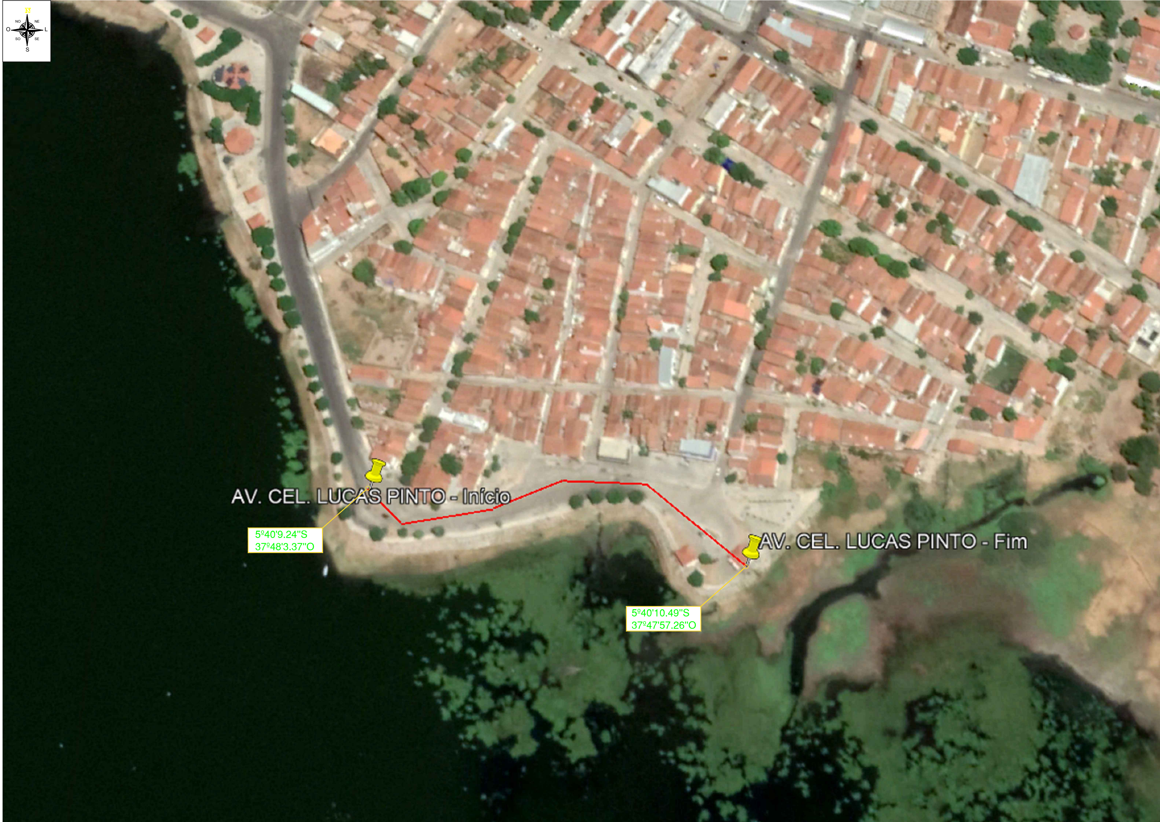
PLANTA DE SITUAÇÃO Pavimentações, Apodi/RN Escala: 1/300