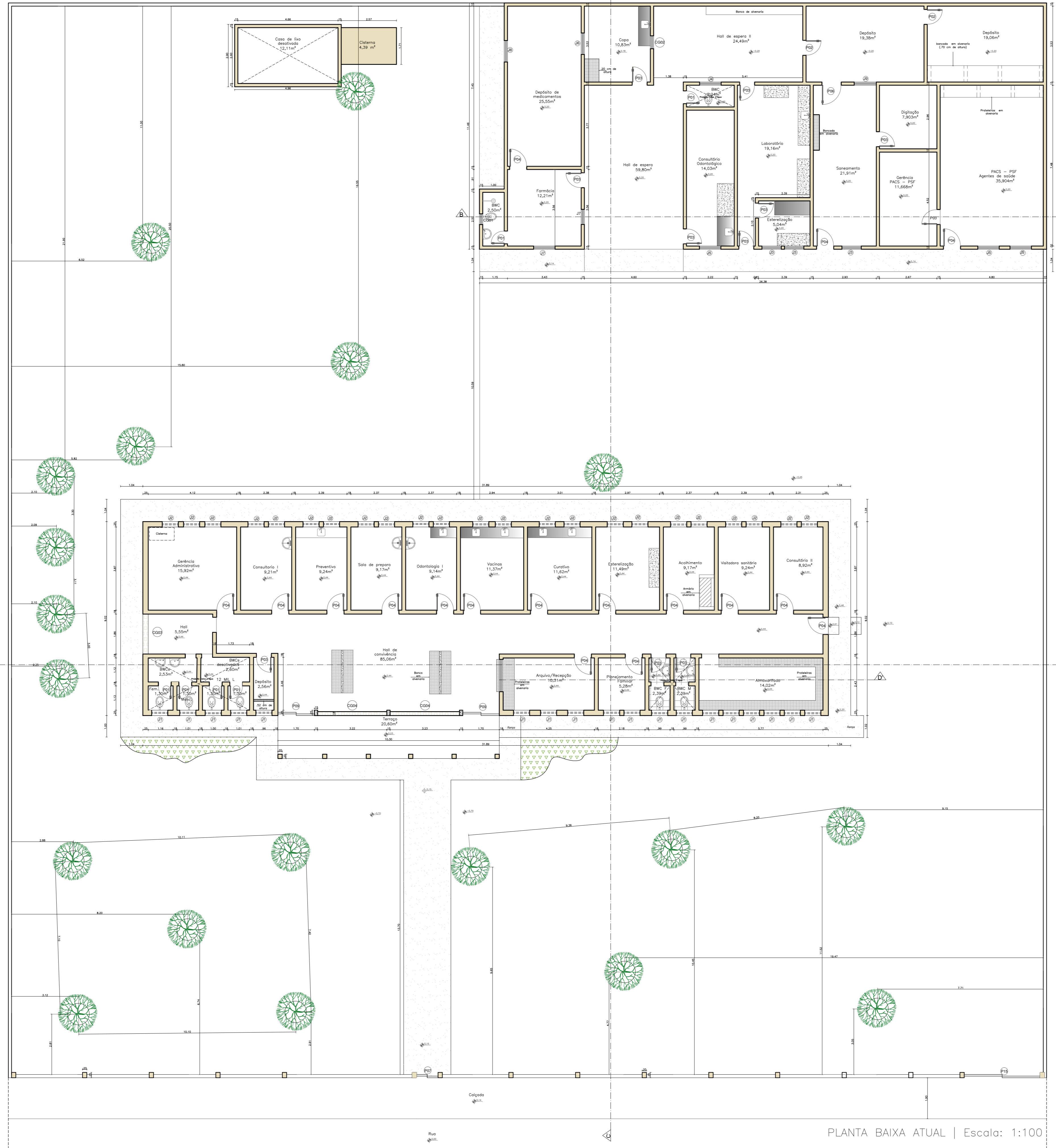
PLANTA BAIXA ATUAL | Escala: 1:100