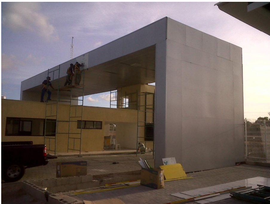
PORTICO RIO GRANDENSE – BR 101