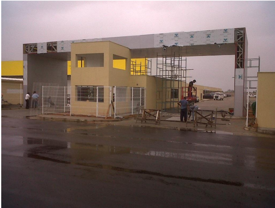
PORTICO RIO GRANDENSE – BR 101