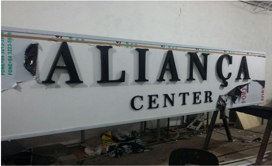
TOTEM ALIANÇA CENTER LETRAS ACM