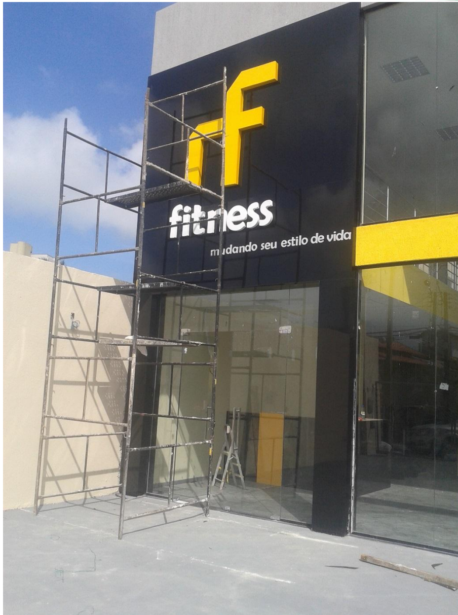
ACADEMIA NISHIAMA FITNESS