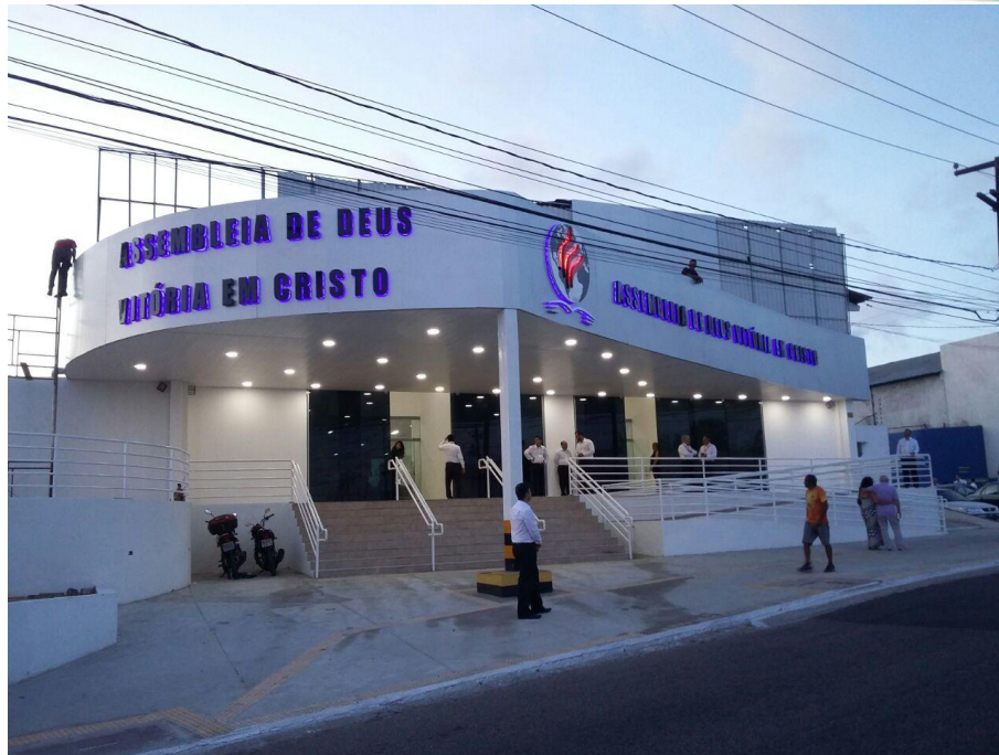
FACHADA ADVEC – ZONA NORTE