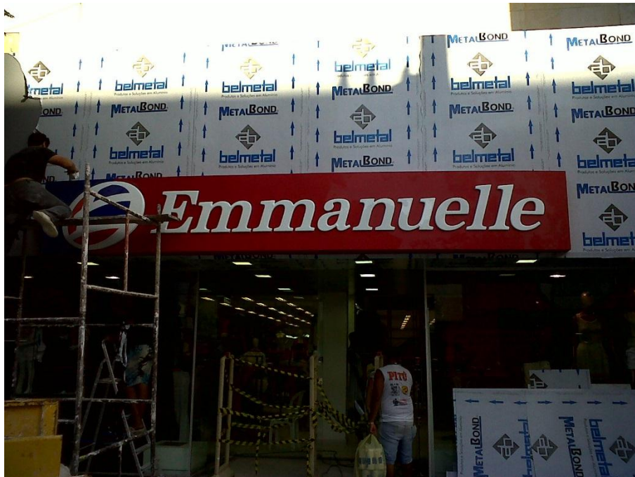
FACHADA EMMANUELLE – CENTRO