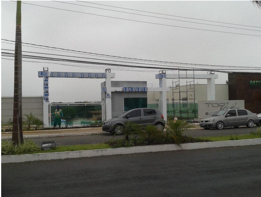
PORTICO ENTRADA – TOP LIFE-MARIA LACERDA-MRV