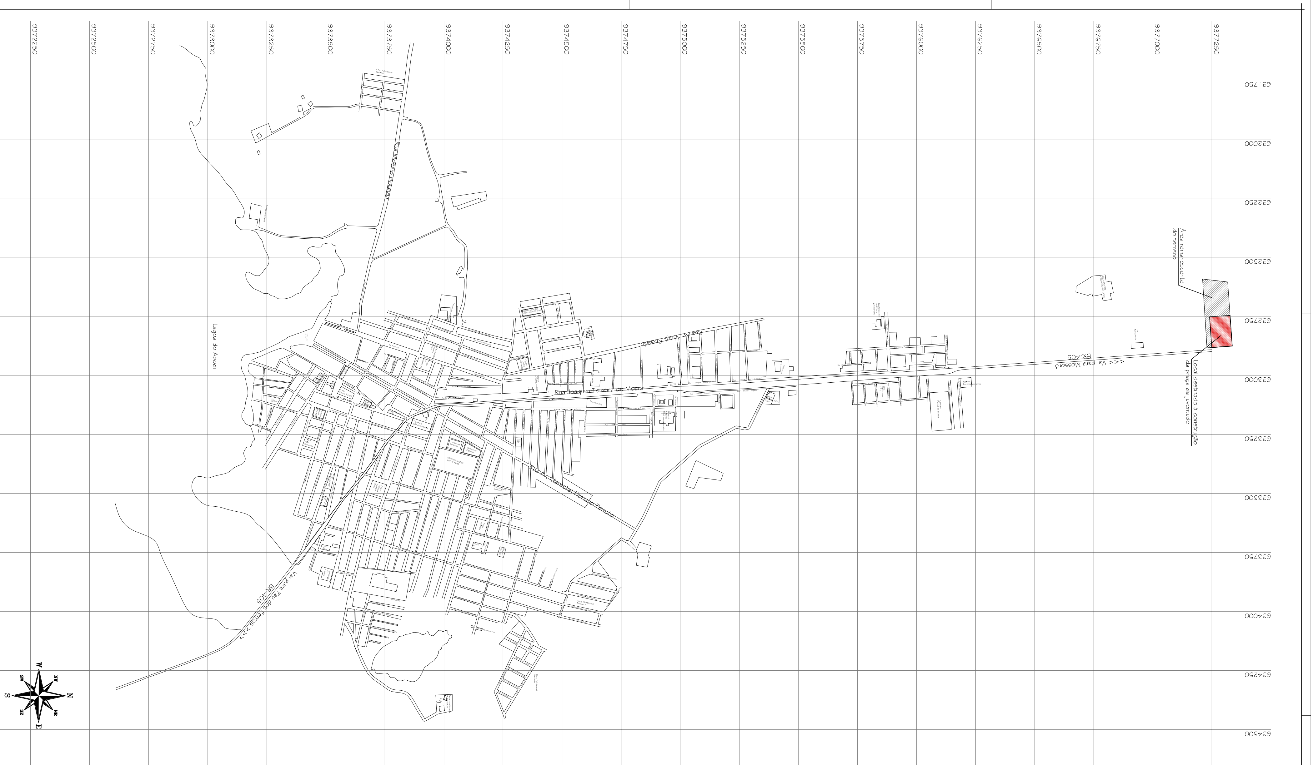
PLANTA DE SITUAÇÃO/LOCALIZAÇÃO ESCALA: 1/150