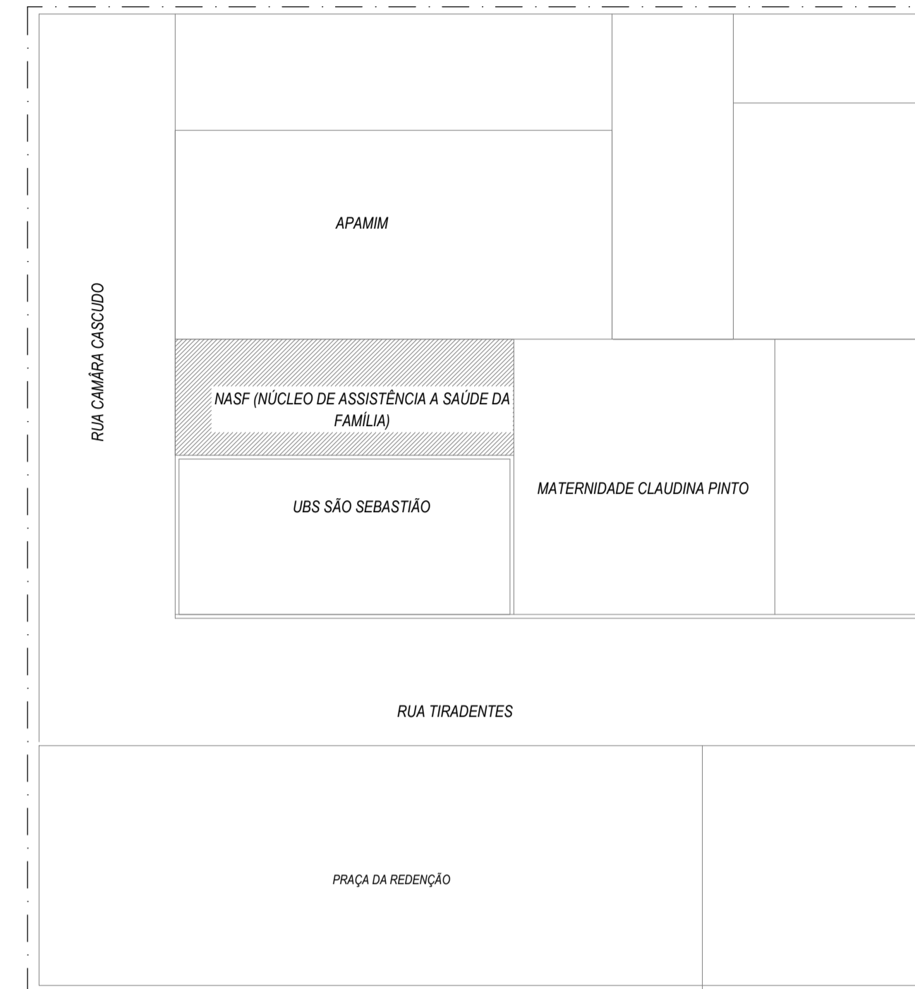
Planta de Situação | Sem Escala