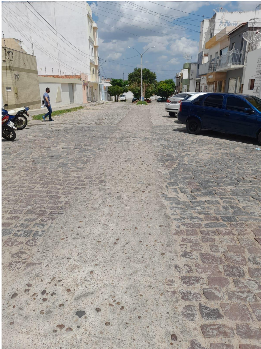
Rua Epitácio Nogueira

OBRA: CAPEAMENTO ASFÁLTICO EM TRECHOS DE VIAS NA ZONA URBANA DE APODI/RN ENDEREÇO: DIVERSAS RUAS,- ZONA URBANA - APODI/RN RELATÓRIO FOTOGRÁFICO DA SITUAÇÃO ATUAL.