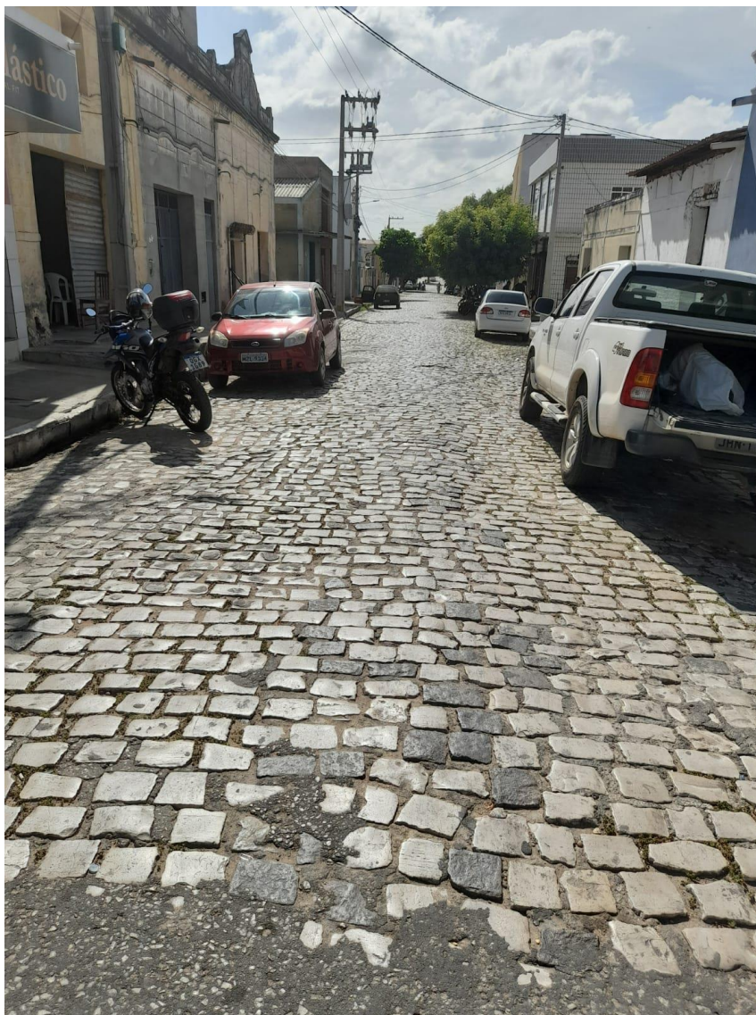
Rua Cel. João de Brito

OBRA: CAPEAMENTO ASFÁLTICO EM TRECHOS DE VIAS NA ZONA URBANA DE APODI/RN ENDEREÇO: DIVERSAS RUAS,- ZONA URBANA - APODI/RN RELATÓRIO FOTOGRÁFICO DA SITUAÇÃO ATUAL.