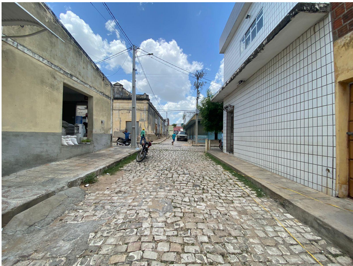
Rua Elísio Reinaldo

OBRA: CAPEAMENTO ASFÁLTICO EM TRECHOS DE VIAS NA ZONA URBANA DE APODI/RN ENDEREÇO: DIVERSAS RUAS,- ZONA URBANA - APODI/RN RELATÓRIO FOTOGRÁFICO DA SITUAÇÃO ATUAL.