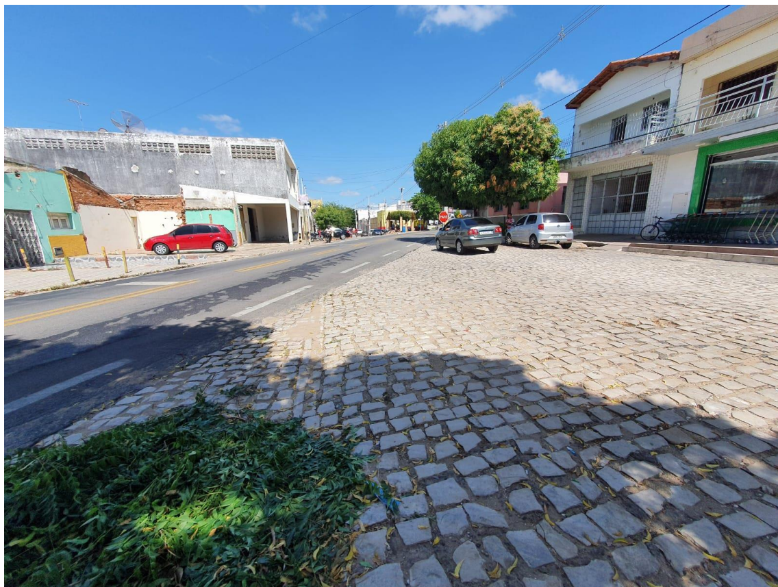
Rua Antônio Lopes Filho

OBRA: CAPEAMENTO ASFÁLTICO EM TRECHOS DE VIAS NA ZONA URBANA DE APODI/RN ENDEREÇO: DIVERSAS RUAS,- ZONA URBANA - APODI/RN RELATÓRIO FOTOGRÁFICO DA SITUAÇÃO ATUAL.