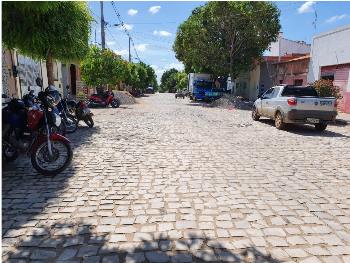
Rua Antônio Lopes Filho

OBRA: CAPEAMENTO ASFÁLTICO EM TRECHOS DE VIAS NA ZONA URBANA DE APODI/RN ENDEREÇO: DIVERSAS RUAS,- ZONA URBANA - APODI/RN RELATÓRIO FOTOGRÁFICO DA SITUAÇÃO ATUAL.