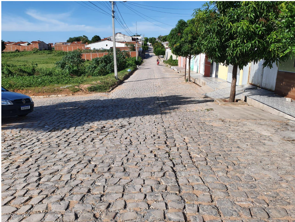
Rua Marechal Floriano Peixoto

OBRA: CAPEAMENTO ASFÁLTICO EM TRECHOS DE VIAS NA ZONA URBANA DE APODI/RN ENDEREÇO: DIVERSAS RUAS,- ZONA URBANA - APODI/RN RELATÓRIO FOTOGRÁFICO DA SITUAÇÃO ATUAL.