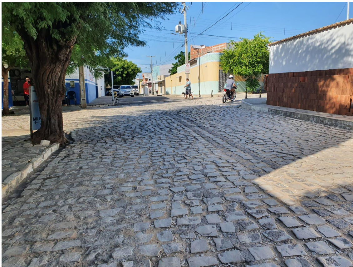
Rua Marechal Floriano Peixoto

OBRA: CAPEAMENTO ASFÁLTICO EM TRECHOS DE VIAS NA ZONA URBANA DE APODI/RN ENDEREÇO: DIVERSAS RUAS,- ZONA URBANA - APODI/RN RELATÓRIO FOTOGRÁFICO DA SITUAÇÃO ATUAL.