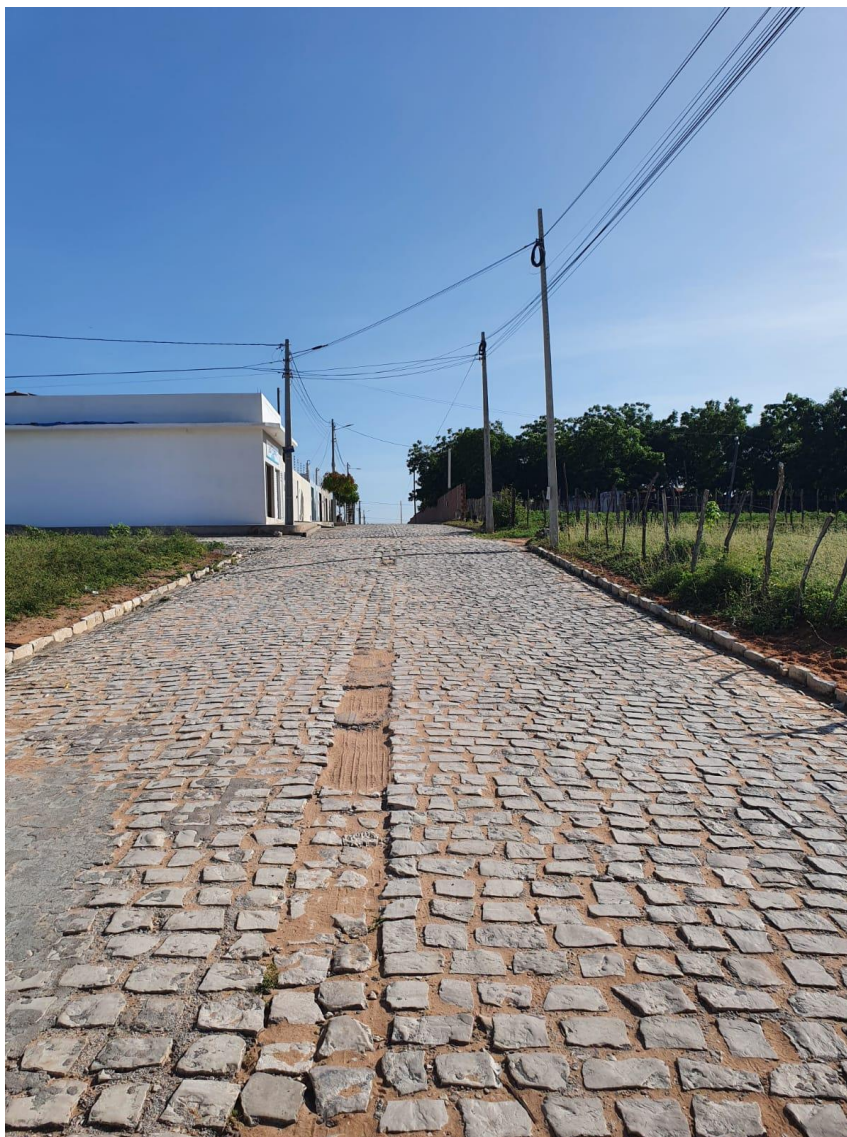
Rua Marechal Floriano Peixoto

OBRA: CAPEAMENTO ASFÁLTICO EM TRECHOS DE VIAS NA ZONA URBANA DE APODI/RN ENDEREÇO: DIVERSAS RUAS,- ZONA URBANA - APODI/RN RELATÓRIO FOTOGRÁFICO DA SITUAÇÃO ATUAL.