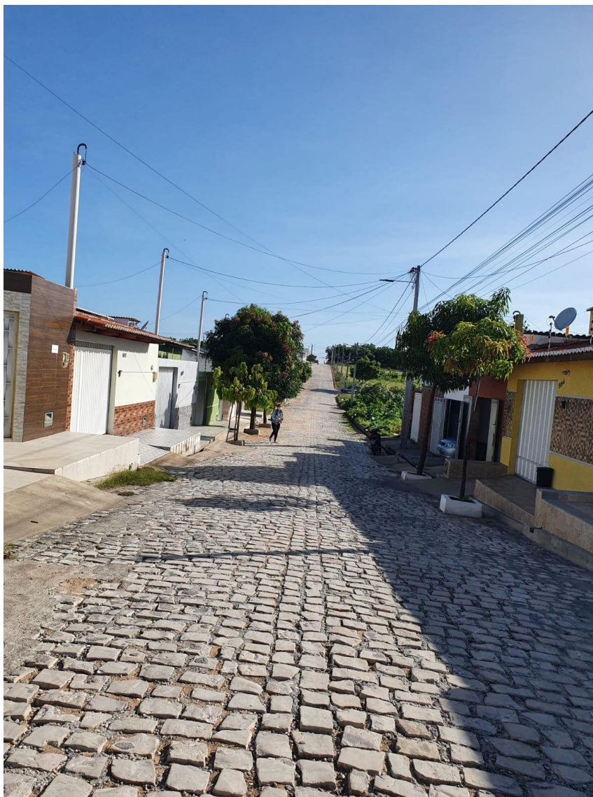
Rua Marechal Floriano Peixoto

OBRA: CAPEAMENTO ASFÁLTICO EM TRECHOS DE VIAS NA ZONA URBANA DE APODI/RN ENDEREÇO: DIVERSAS RUAS,- ZONA URBANA - APODI/RN RELATÓRIO FOTOGRÁFICO DA SITUAÇÃO ATUAL.