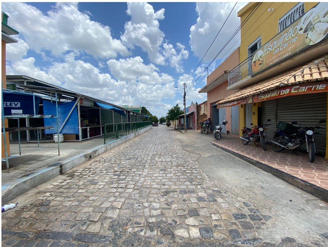
Rua Cel. João Jázimo

OBRA: CAPEAMENTO ASFÁLTICO EM TRECHOS DE VIAS NA ZONA URBANA DE APODI/RN ENDEREÇO: DIVERSAS RUAS,- ZONA URBANA - APODI/RN RELATÓRIO FOTOGRÁFICO DA SITUAÇÃO ATUAL.