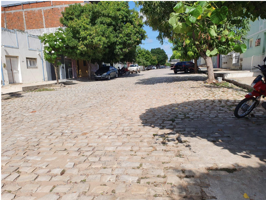
Rua Antônio Lopes Filho

OBRA: CAPEAMENTO ASFÁLTICO EM TRECHOS DE VIAS NA ZONA URBANA DE APODI/RN ENDEREÇO: DIVERSAS RUAS,- ZONA URBANA - APODI/RN RELATÓRIO FOTOGRÁFICO DA SITUAÇÃO ATUAL.