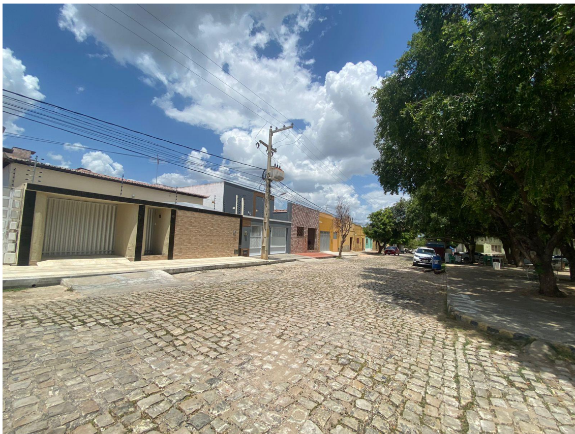
Rua Cel. João de Brito

OBRA: CAPEAMENTO ASFÁLTICO EM TRECHOS DE VIAS NA ZONA URBANA DE APODI/RN ENDEREÇO: DIVERSAS RUAS,- ZONA URBANA - APODI/RN RELATÓRIO FOTOGRÁFICO DA SITUAÇÃO ATUAL.