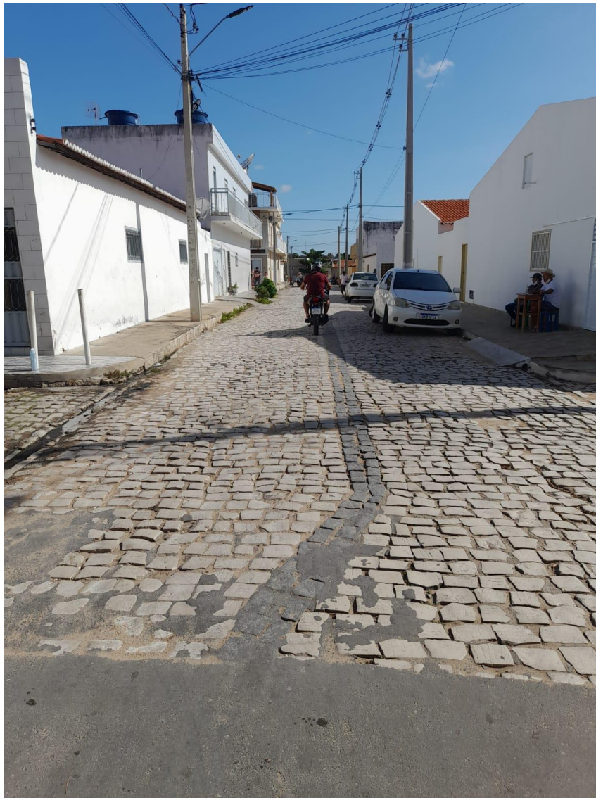
Rua Almirante Barroso

OBRA: CAPEAMENTO ASFÁLTICO EM TRECHOS DE VIAS NA ZONA URBANA DE APODI/RN ENDEREÇO: DIVERSAS RUAS,- ZONA URBANA - APODI/RN RELATÓRIO FOTOGRÁFICO DA SITUAÇÃO ATUAL.