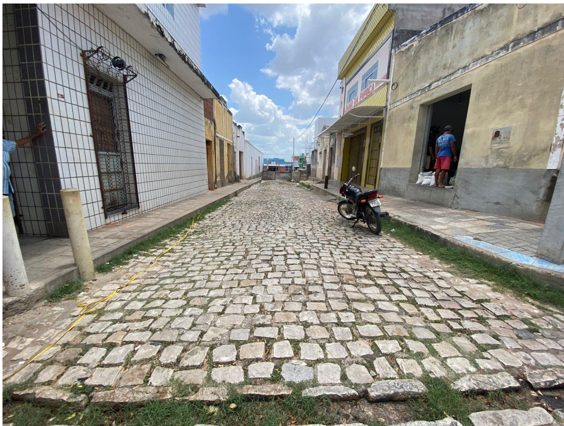
Rua Elísio Reinaldo

OBRA: CAPEAMENTO ASFÁLTICO EM TRECHOS DE VIAS NA ZONA URBANA DE APODI/RN ENDEREÇO: DIVERSAS RUAS,- ZONA URBANA - APODI/RN RELATÓRIO FOTOGRÁFICO DA SITUAÇÃO ATUAL.