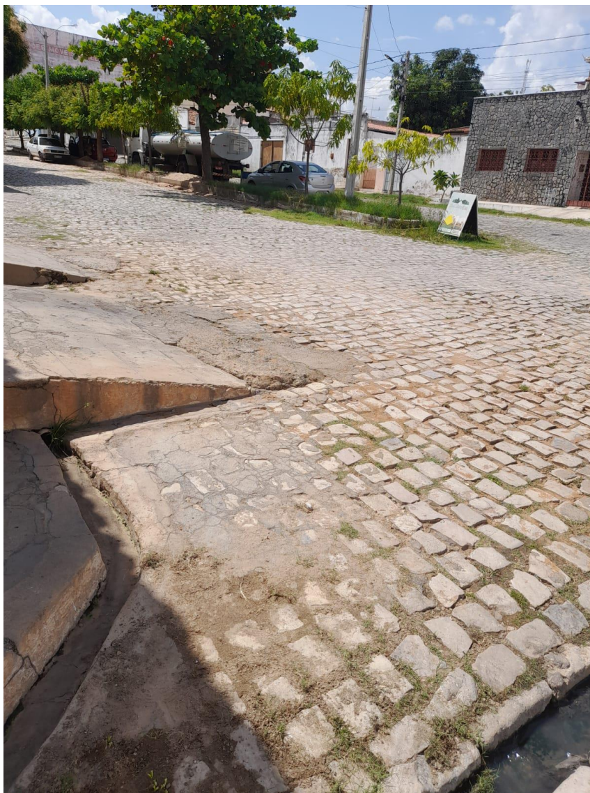
Rua Epitácio Nogueira

OBRA: CAPEAMENTO ASFÁLTICO EM TRECHOS DE VIAS NA ZONA URBANA DE APODI/RN ENDEREÇO: DIVERSAS RUAS,- ZONA URBANA - APODI/RN RELATÓRIO FOTOGRÁFICO DA SITUAÇÃO ATUAL.