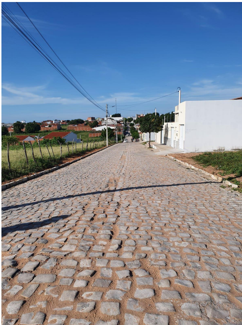
Rua Marechal Floriano Peixoto

OBRA: CAPEAMENTO ASFÁLTICO EM TRECHOS DE VIAS NA ZONA URBANA DE APODI/RN ENDEREÇO: DIVERSAS RUAS,- ZONA URBANA - APODI/RN RELATÓRIO FOTOGRÁFICO DA SITUAÇÃO ATUAL.