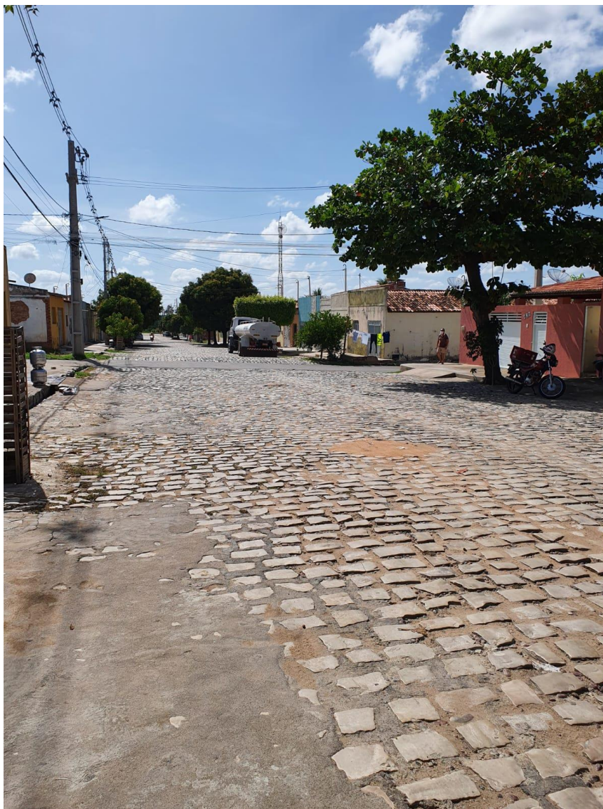
Rua Antônio Lopes Filho

OBRA: CAPEAMENTO ASFÁLTICO EM TRECHOS DE VIAS NA ZONA URBANA DE APODI/RN ENDEREÇO: DIVERSAS RUAS,- ZONA URBANA - APODI/RN RELATÓRIO FOTOGRÁFICO DA SITUAÇÃO ATUAL.