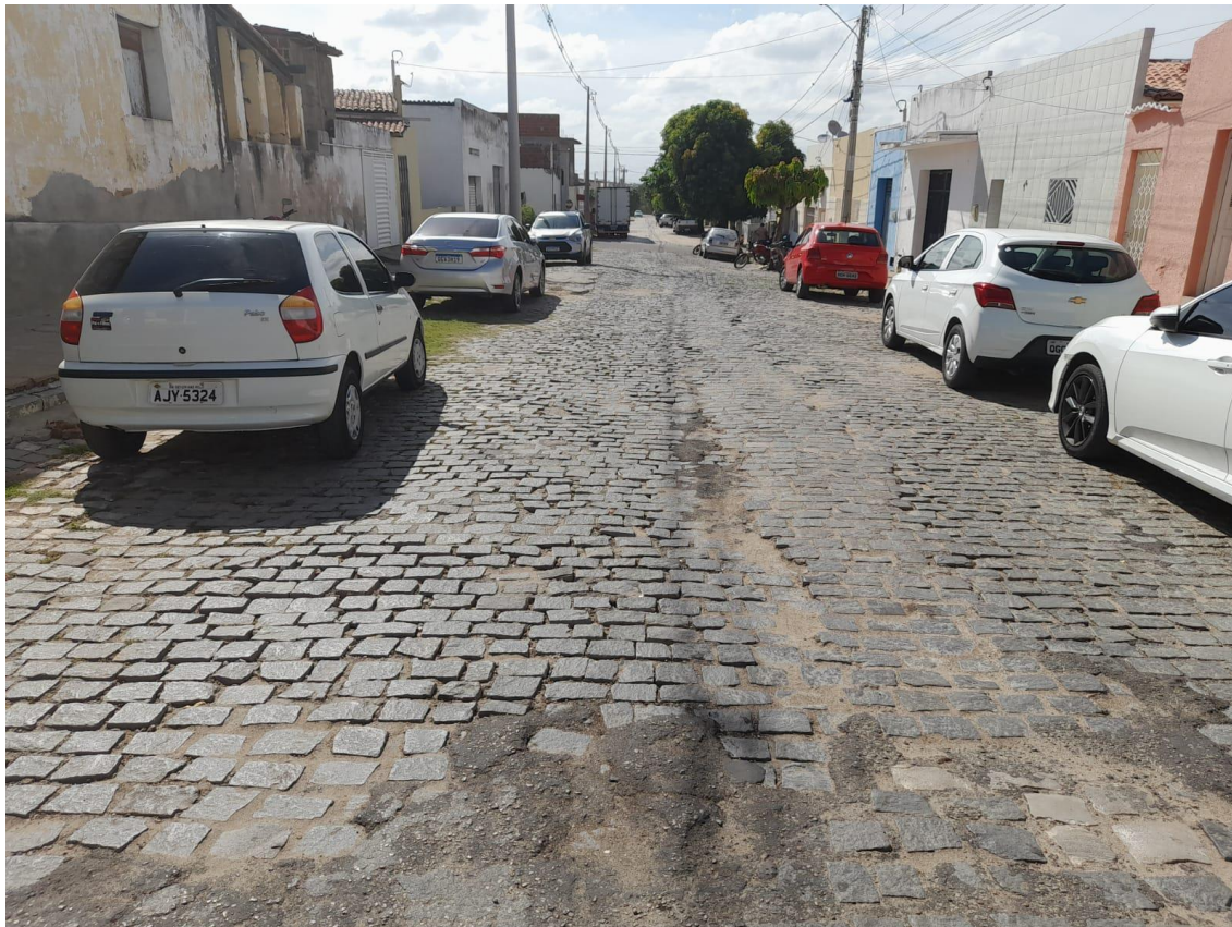
Rua João Pessoa

OBRA: CAPEAMENTO ASFÁLTICO EM TRECHOS DE VIAS NA ZONA URBANA DE APODI/RN ENDEREÇO: DIVERSAS RUAS,- ZONA URBANA - APODI/RN RELATÓRIO FOTOGRÁFICO DA SITUAÇÃO ATUAL.