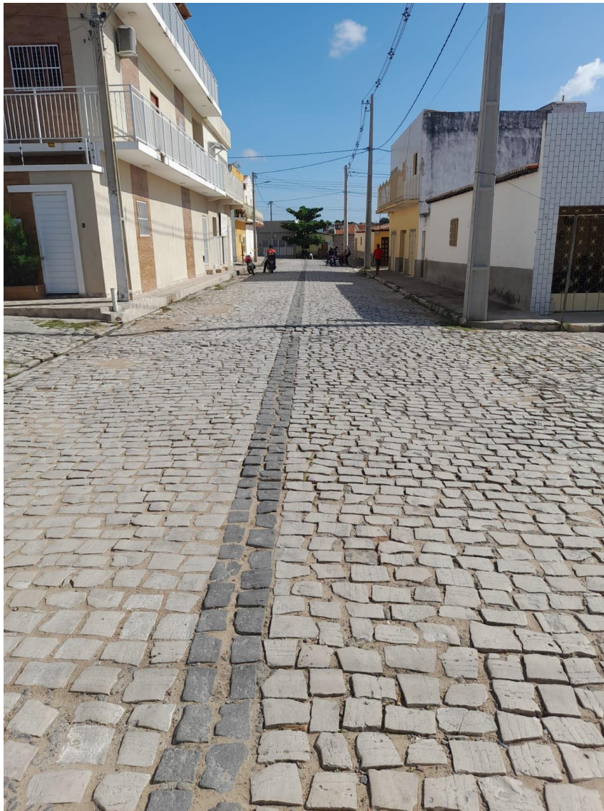
Rua Almirante Barroso

OBRA: CAPEAMENTO ASFÁLTICO EM TRECHOS DE VIAS NA ZONA URBANA DE APODI/RN ENDEREÇO: DIVERSAS RUAS,- ZONA URBANA - APODI/RN RELATÓRIO FOTOGRÁFICO DA SITUAÇÃO ATUAL.