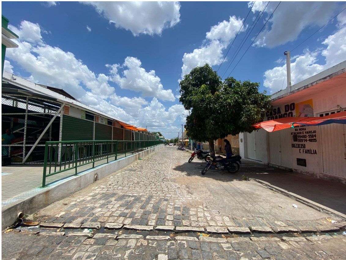
Rua Cel. João Jázimo

OBRA: CAPEAMENTO ASFÁLTICO EM TRECHOS DE VIAS NA ZONA URBANA DE APODI/RN ENDEREÇO: DIVERSAS RUAS,- ZONA URBANA - APODI/RN RELATÓRIO FOTOGRÁFICO DA SITUAÇÃO ATUAL.