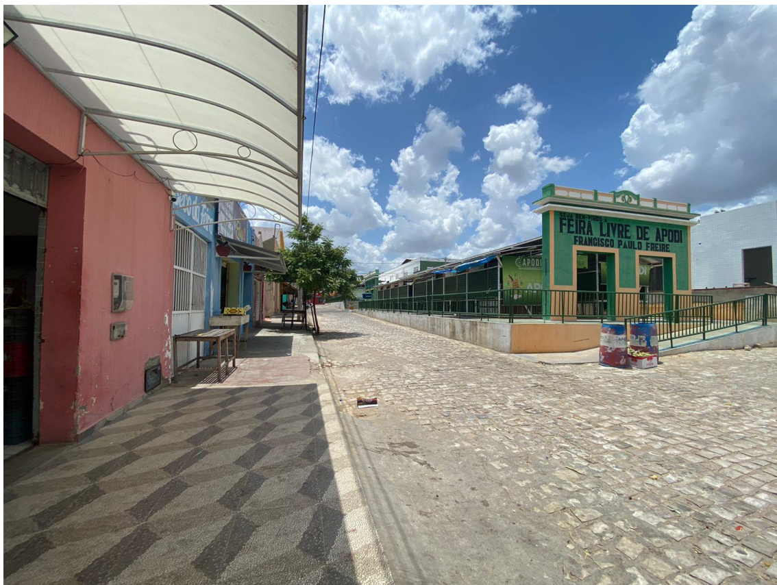
Rua Cel. João Jázimo

OBRA: CAPEAMENTO ASFÁLTICO EM TRECHOS DE VIAS NA ZONA URBANA DE APODI/RN ENDEREÇO: DIVERSAS RUAS,- ZONA URBANA - APODI/RN RELATÓRIO FOTOGRÁFICO DA SITUAÇÃO ATUAL.