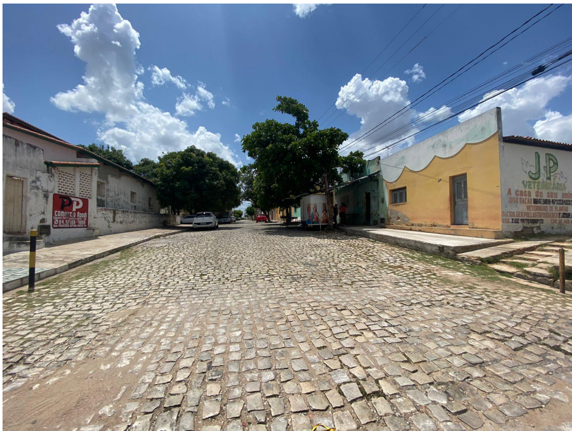
Rua Cel. João de Brito

OBRA: CAPEAMENTO ASFÁLTICO EM TRECHOS DE VIAS NA ZONA URBANA DE APODI/RN ENDEREÇO: DIVERSAS RUAS,- ZONA URBANA - APODI/RN RELATÓRIO FOTOGRÁFICO DA SITUAÇÃO ATUAL.