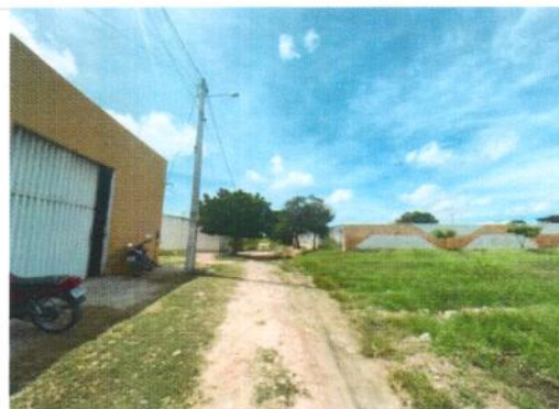
Vista geral da Rua Luiza Cantofa