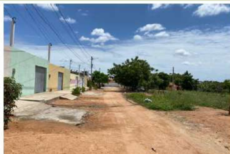
Vista geral da Rua Francisco Canindé de Lima