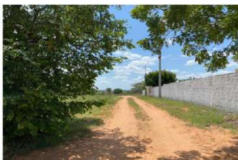
Vista geral da Rua Maria Romana Leite