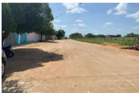
Vista geral da Rua Luiz Antonio Torres