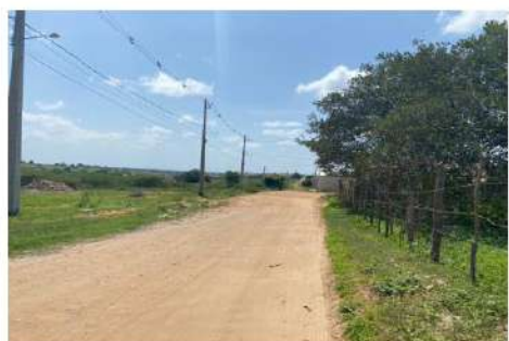
Vista geral da Rua Luiz Antonio Torres