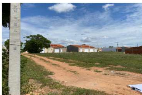
Vista geral da Rua Maria Romana Leite