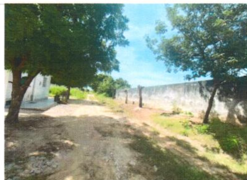
Vista geral da Rua Luiza Cantofa