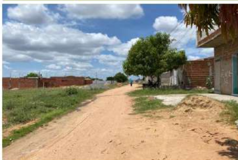
Vista geral da Rua Francisco Canindé de Lima