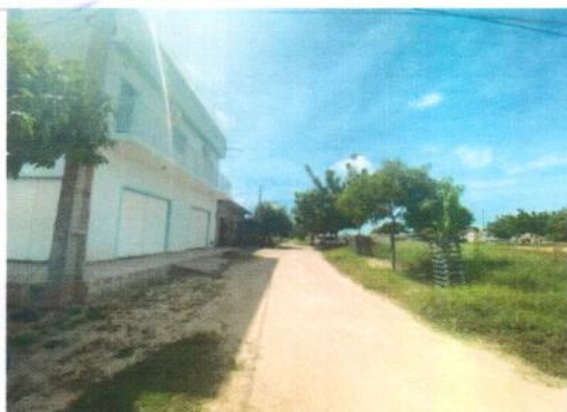
Vista geral da Rua Luiza Cantofa