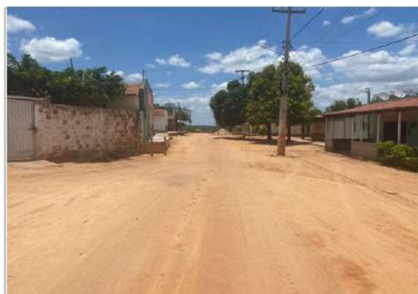
Vista geral da Rua no Sítio Soledade