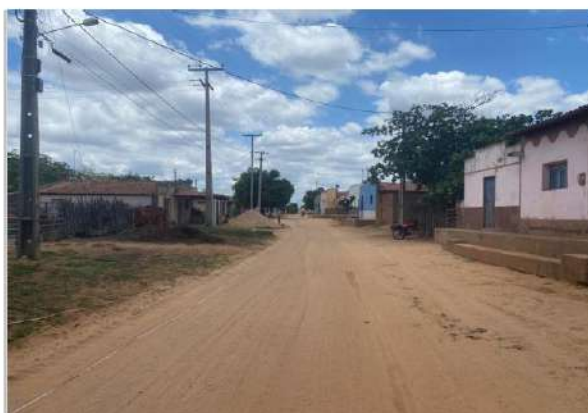
Vista geral da Rua no Sítio Soledade