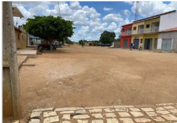
Vista geral da Rua no Sítio Corrego