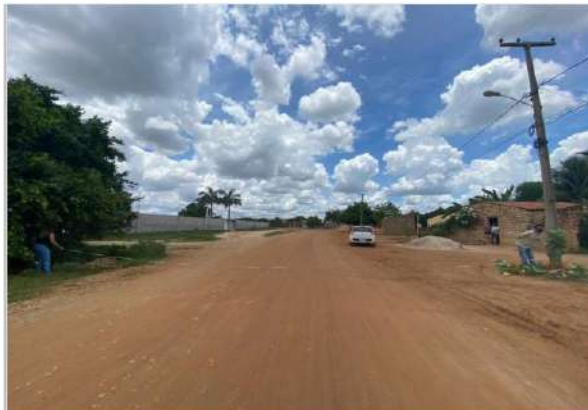
Vista geral da Rua no Sítio Corrego