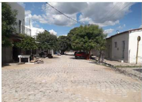
Rua Adrião Bezerra (trecho 2) - início