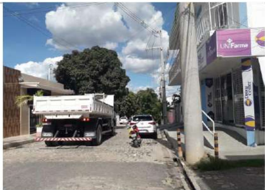
Rua Adrião Bezerra (trecho 1) - início