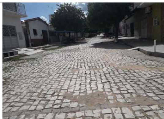
Rua Adrião Bezerra (trecho 2) - final