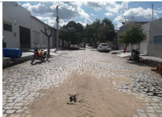
Rua Adrião Bezerra (trecho 1) - final